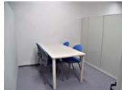
商談打合せスペース (3ブース)