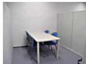
商談打合せスペース (3 ブース)