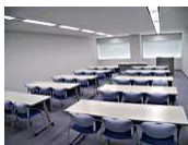
マルチパーパスルーム (定員 30 名)